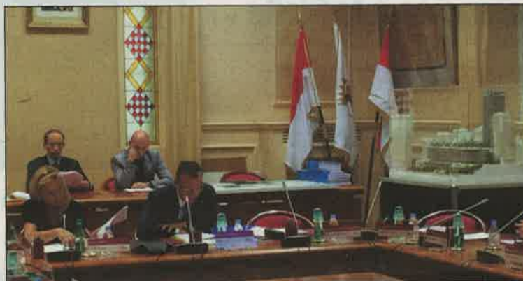
Le conseil communal a voté le dossier d'urbanisme Testimonio II à l'unanimité. Ici, à droite et en arrière plan, la maquette du projet de l'architecte Alexandre Giraldi.

“Des ondulations de plus en plus rapprochées”